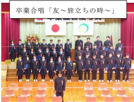
卒業合唱「友～旅立ちの時～」